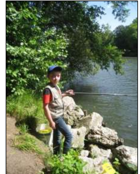
5 février 2019